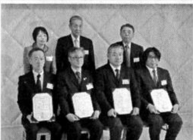
排出事業者の環境配慮の取り組みが評価された

排出事業者の環境配慮の取り組みが評価された。2014年には新工場を設立。屋上での太陽光発電や水の循環システムの採用など、最大限の採用など、最大限の環境に配慮した設計を施している。同賞は、環境に配慮し持続可能な経営を行っている経営者を対象に表彰している。産業廃棄物処理・リサイクル業ではこれまでに10社以上の企業が受賞している。15年度は▽日本ウエストーン▽東新プラスチック▽西尾硝子鏡工業所▽本杉工機の4社が受賞した。